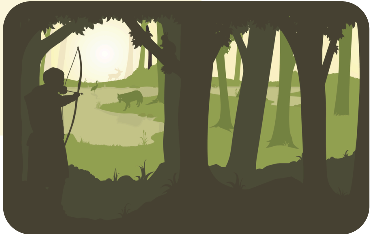
Illustration "Avoir sa peau" © MPMM

09/07/2025 – 16/07/2025 23/07/2025 – 30/07/2025