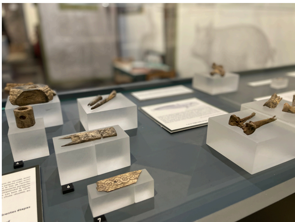
Éléments en bois de cerf et ossements d'animaux, époque médiévale (coll. AWaP)