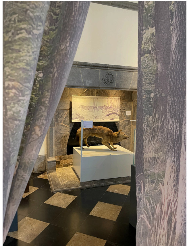
Loup naturalisé, 19 e s. (coll. Séminaire de Floreffe)