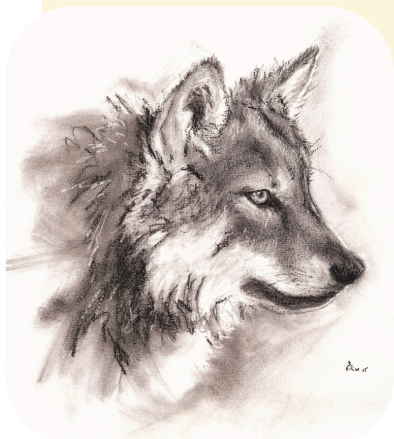
Illustration © Elise Pire