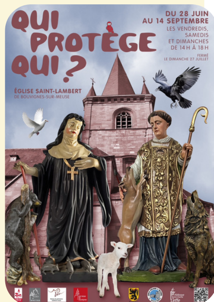
Affiche "Qui protège qui ?"

Sous forme de clin d'œil, l'exposition lève un coin du voile sur le monde à venir où hommes et bêtes veillent les uns sur les autres pour retisser, ensemble, les harmonies perdues.