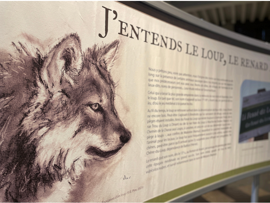
Exposition Avoir sa peau, 2025