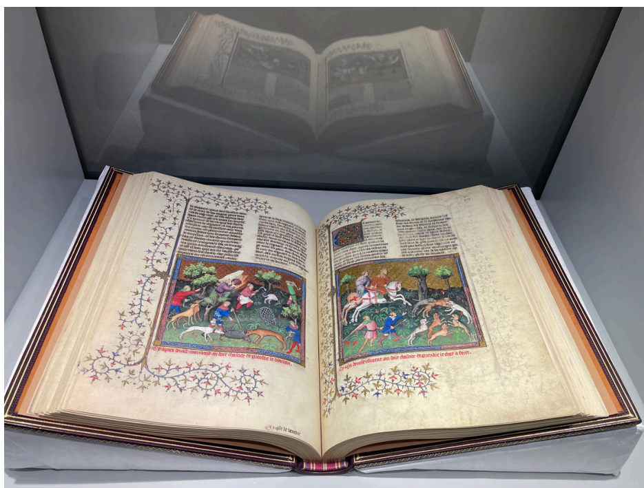
Fac-similé du Livre de la chasse de Gaston Fébus, 15 e s. (coll. J.-B. Raty, photo © MPMM)