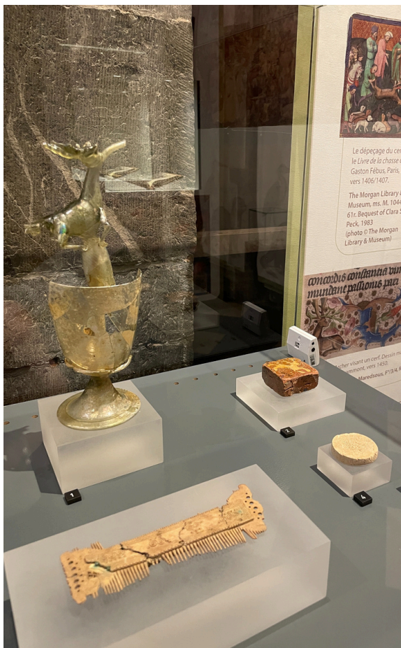
Peigne en bois de cerf,, 5 e -6 e s. Verre à surprise surmonté d'un cerf, 16 e s. Carreau de pavement décoré d'un cerf, 13 e -14 e s. (coll. AWaP) Jeton de jeu en bois de cervidé, ép. médiévale (coll. Musée du château fort de Logne)