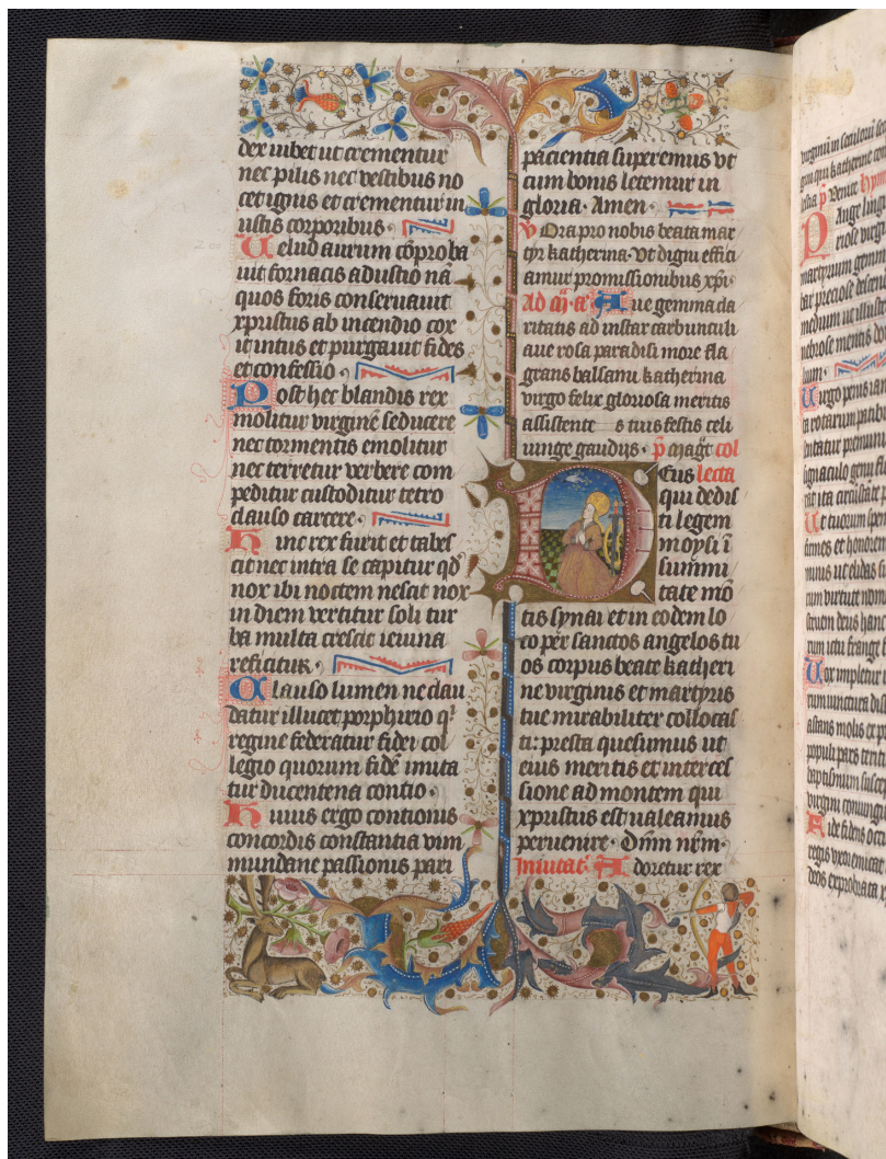
Bréviaire de Grammont, 1450. Classé trésor de la Fédération Wallonie-Bruxelles (coll. Abbaye de Maredsous)