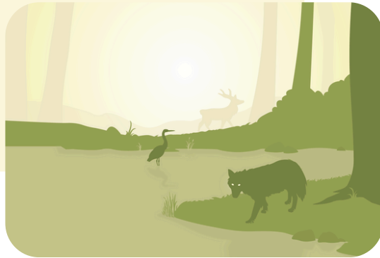
Illustration "Avoir sa peau" © MPMM