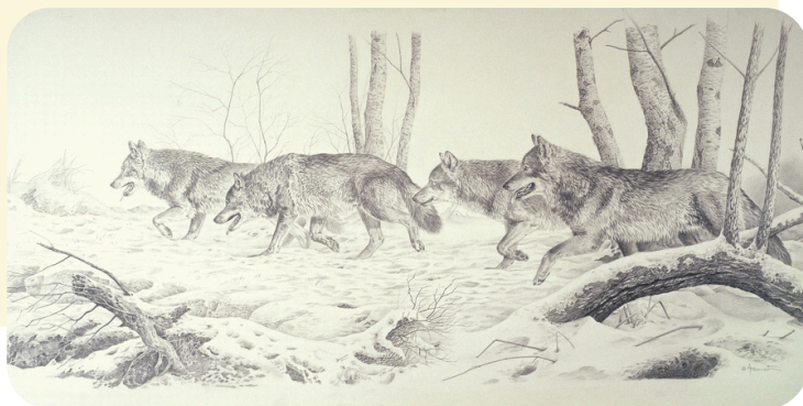
Illustration © A. Buzin