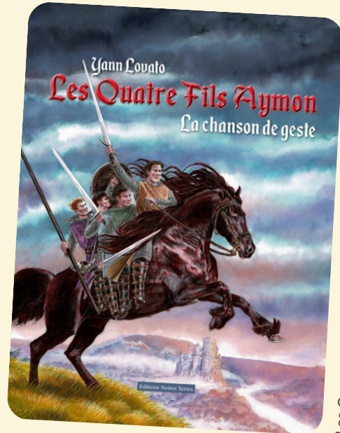
Les Quatre Fils Aymon. La chanson de geste-Yann Lovato © Editions Noires Terres

Cette exposition sera proposée au dernier étage de la Maison espagnole, rendu pour la première fois accessible aux visiteurs.