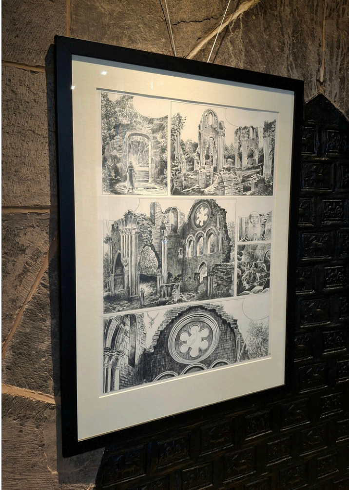
Jean-Claude Servais, Orval, planche 086 (Coll. Musée de la Grande Ardenne, Bastogne)