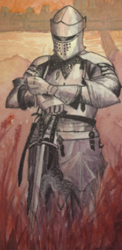
Illustration © Emilie Pondeville