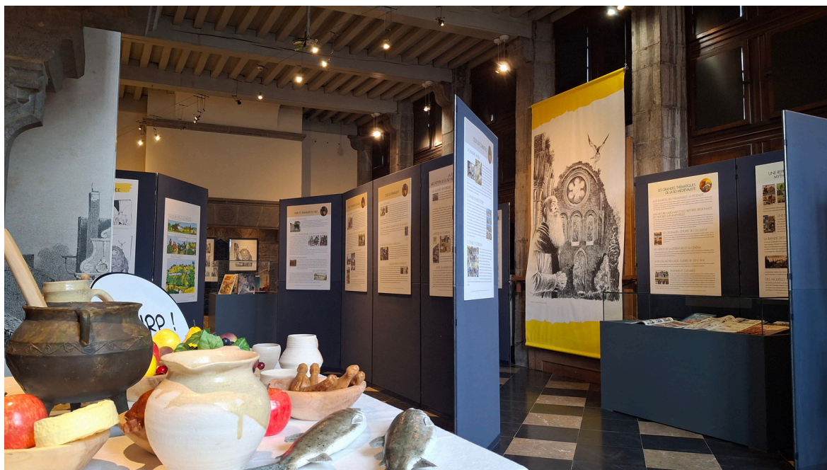
Exposition Le Moyen Âge dans la bande dessinée