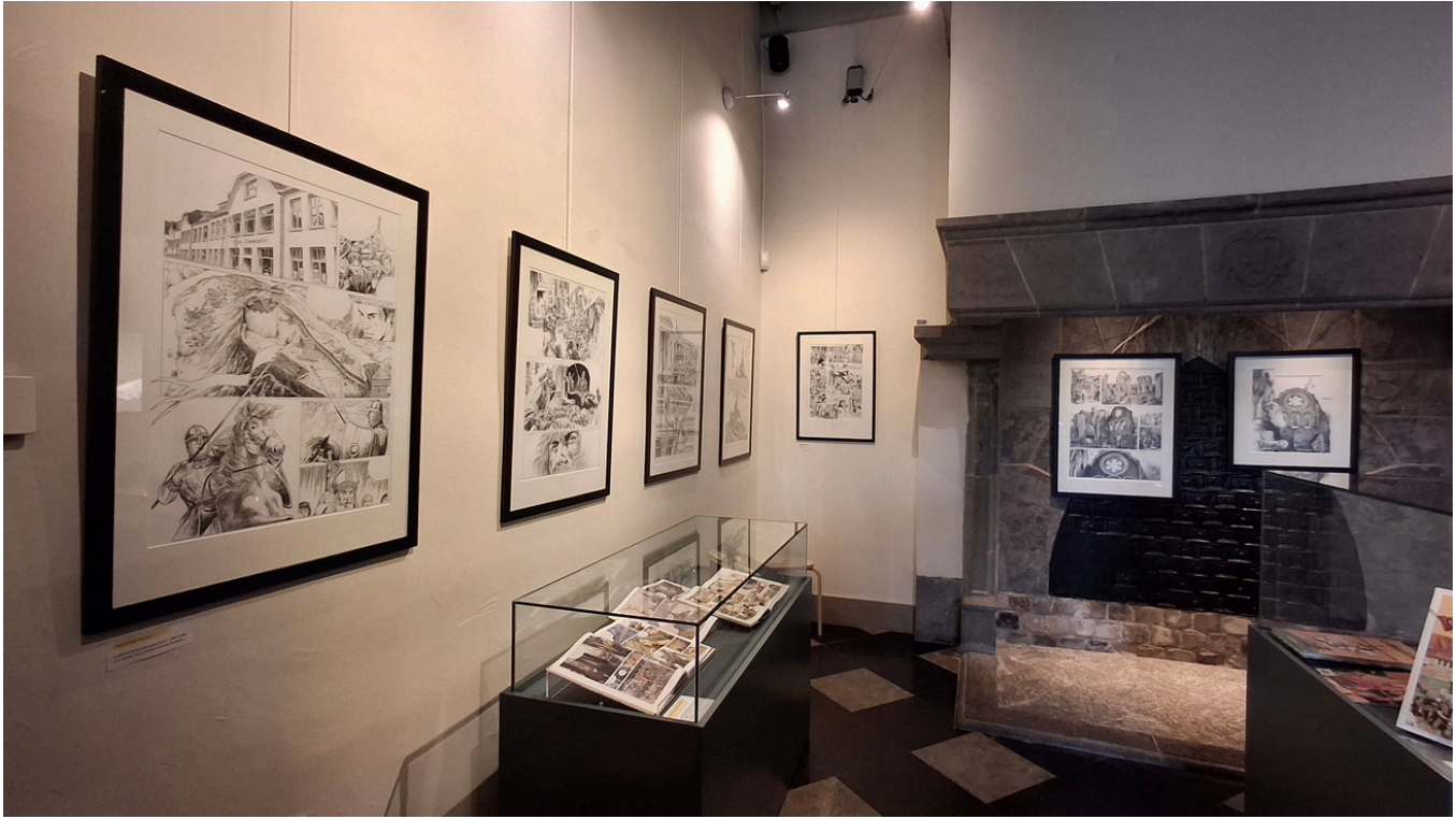
Jean-Claude Servais, - Godefroid de Bouillon , planches 017, 088 et 096 -Les chemins de Compostelle. 1 : Petite licorne, planche 039 -Isabelle, planche 022 -Orval, planche 086 et couverture

(Coll. Musée de la Grande Ardenne, Bastogne)